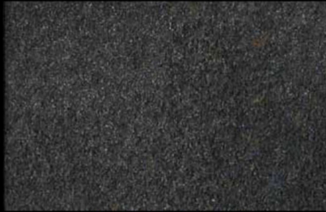
451 A + ADDITIVO SILVER G 200 KLONDIKE (LT. 1) + COLORÍ Col. 451 (6 ML.) + G 200 (LT. 0,100) KLONDIKE (LT. 2,5) + COLORÍ Col. 451 (15 ML.) + G 200 (LT. 0,250)