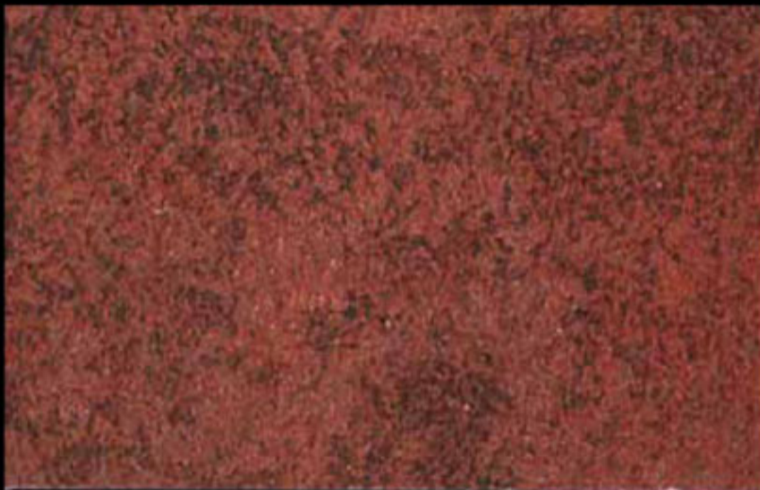
426 A + ADDITIVO GOLD G 100 KLONDIKE (LT. 1) + COLORÍ Col. 426 (6 ML.) + G 100 (LT. 0,100) KLONDIKE (LT. 2,5) + COLORÍ Col. 426 (15 ML.) + G 100 (LT. 0,250)