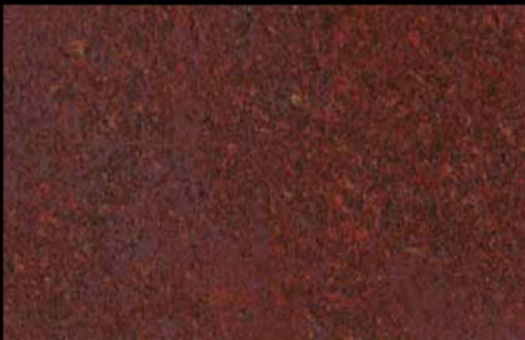
426 A KLONDIKE (LT. 1) + COLORÍ Col. 426 (6 ML.) KLONDIKE (LT. 2,5) + COLORÍ Col. 426 (15 ML.)