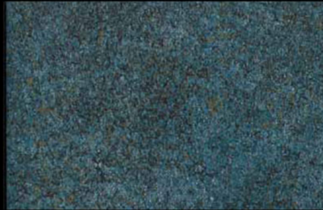
447 A + ADDITIVO SILVER G 200 KLONDIKE (LT. 1) + COLORÍ Col. 447 (6 ML.) + G 200 (LT. 0,100) KLONDIKE (LT. 2,5) + COLORÍ Col. 447 (15 ML.) + G 200 (LT. 0,250)