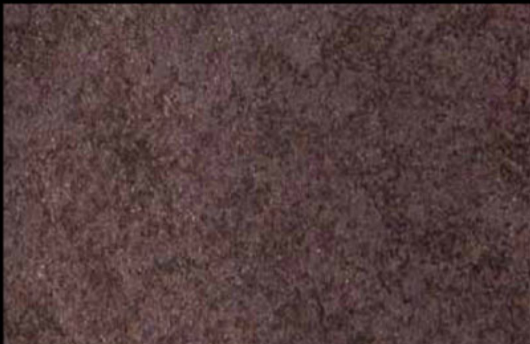
429 A + ADDITIVO GOLD G 100 KLONDIKE (LT. 1) + COLORÍ Col. 429 (6 ML.) + G 100 (LT. 0,100) KLONDIKE (LT. 2,5) + COLORÍ Col. 429 (15 ML.) + G 100 (LT. 0,250)