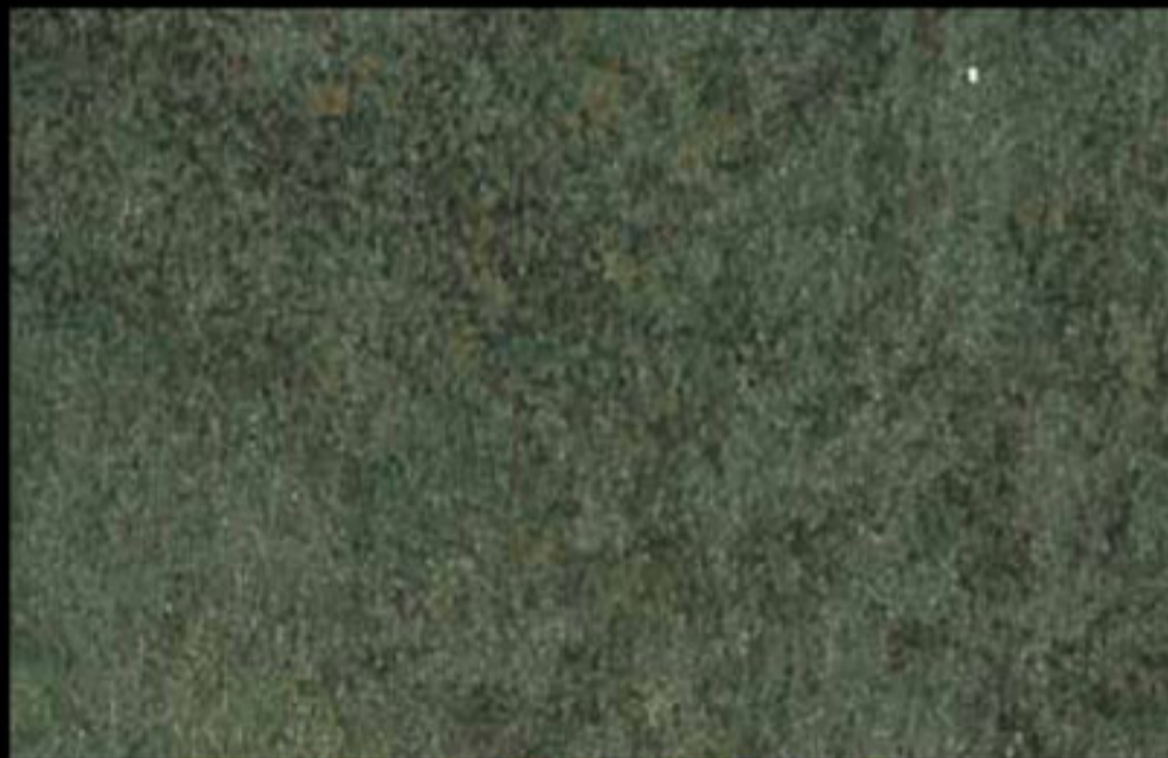
453 A + ADDITIVO GOLD G 100 KLONDIKE (LT. 1) + COLORI Col. 453 (6 ML.) + G 100 (LT. 0,100) KLONDIKE (LT. 2,5) + COLORI Col. 453 (15 ML.) + G 100 (LT. 0,250)