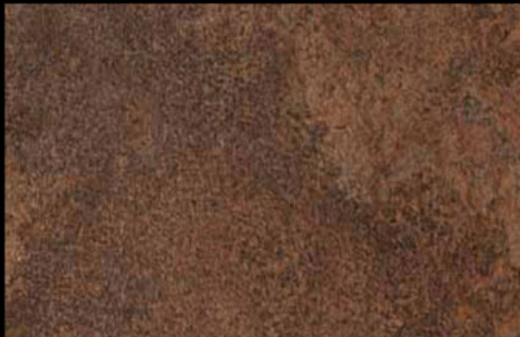
437 A + ADDITIVO GOLD G 100 KLONDIKE (LT. 1) + COLORÍ Col. 437 (6 ML.) + G 100 (LT. 0,100) KLONDIKE (LT. 2,5) + COLORÍ Col. 437 (15 ML.) + G 100 (LT. 0,250)