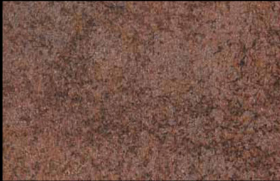
437 A + ADDITIVO SILVER G 200 KLONDIKE (LT. 1) + COLORÍ Col. 437 (6 ML.) + G 200 (LT. 0,100) KLONDIKE (LT. 2,5) + COLORÍ Col. 437 (15 ML.) + G 200 (LT. 0,250)