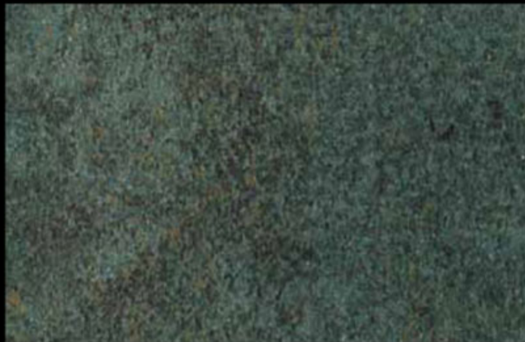
447 A + ADDITIVO GOLD G 100 KLONDIKE (LT. 1) + COLORÍ Col. 447 (6 ML.) + G 100 (LT. 0,100) KLONDIKE (LT. 2,5) + COLORÍ Col. 447 (15 ML.) + G 100 (LT. 0,250)