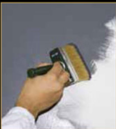
1) Primer 900