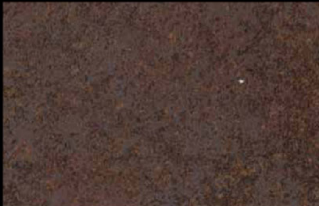
437 A KLONDIKE (LT. 1) + COLORÍ Col. 437 (6 ML.) KLONDIKE (LT. 2,5) + COLORÍ Col. 437 (15 ML.)