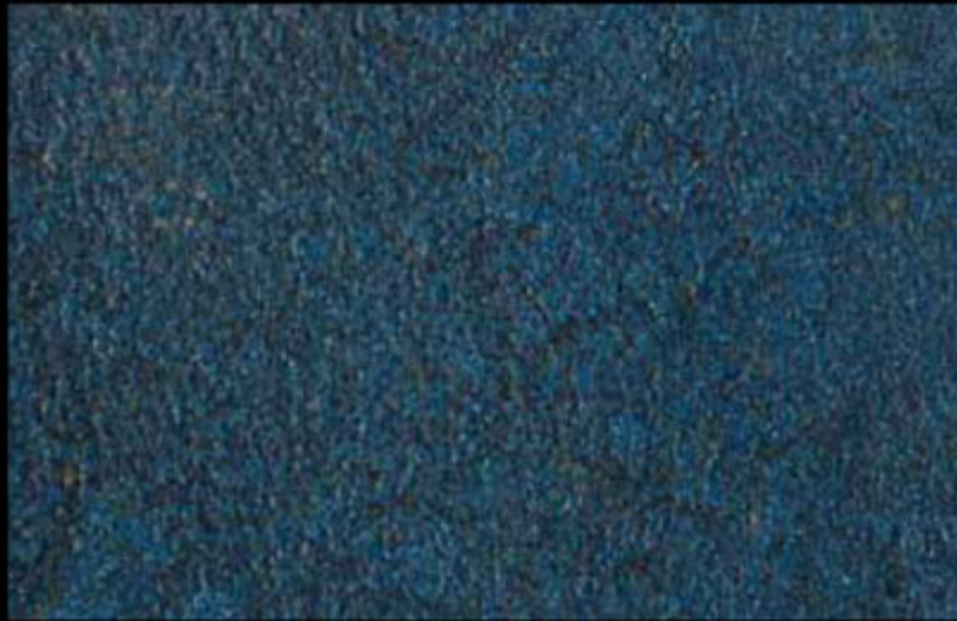
428 A + ADDITIVO SILVER G 200 KLONDIKE (LT. 1) + COLORÍ Col. 428 (6 ML.) + G 200 (LT. 0,100) KLONDIKE (LT. 2,5) + COLORÍ Col. 428 (15 ML.) + G 200 (LT. 0,250)