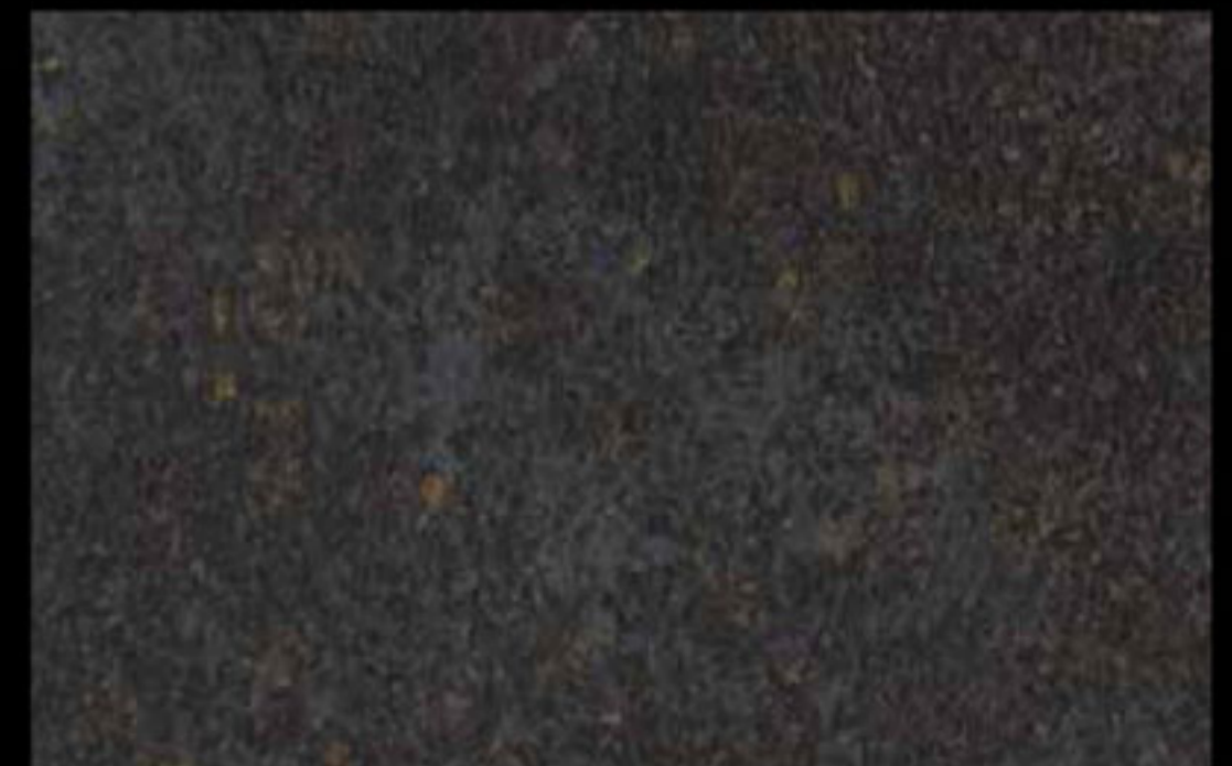
425 A KLONDIKE (LT. 1) + COLORÍ Col. 425 (6 ML.) KLONDIKE (LT. 2,5) + COLORÍ Col. 425 (15 ML.)