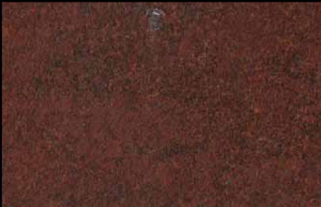
454 A KLONDIKE (LT. 1) + COLORÍ Col. 454 (6 ML.) KLONDIKE (LT. 2,5) + COLORÍ Col. 454 (15 ML.)