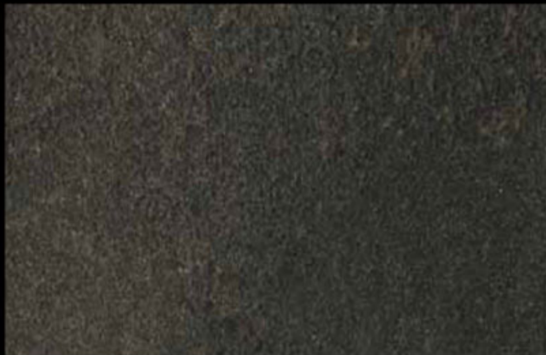
451 A + ADDITIVO GOLD G 100 KLONDIKE (LT. 1) + COLORÍ Col. 451 (6 ML.) + G 100 (LT. 0,100) KLONDIKE (LT. 2,5) + COLORÍ Col. 451 (15 ML.) + G 100 (LT. 0,250)