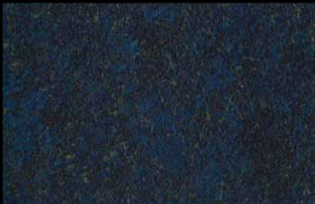
428 A KLONDIKE (LT. 1) + COLORÍ Col. 428 (6 ML.) KLONDIKE (LT. 2,5) + COLORÍ Col. 428 (15 ML.)