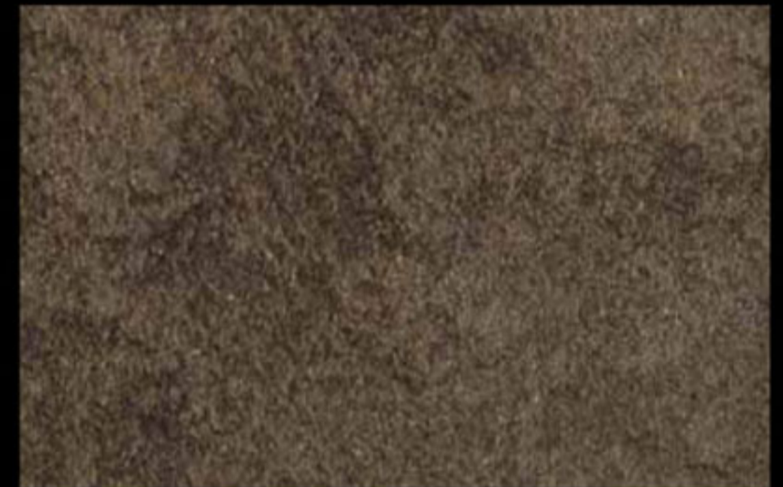
425 A + ADDITIVO GOLD G 100 KLONDIKE (LT. 1) + COLORÍ Col. 425 (6 ML.) + G 100 (LT. 0,100) KLONDIKE (LT. 2,5) + COLORÍ Col. 425 (15 ML.) + G 100 (LT. 0,250)