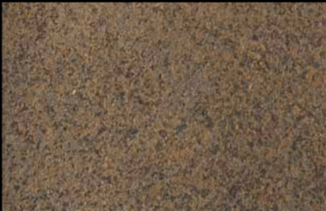
456 A + ADDITIVO GOLD G 100 KLONDIKE (LT. 1) + COLORÍ Col. 456 (6 ML.) + G 100 (LT. 0,100) KLONDIKE (LT. 2,5) + COLORÍ Col. 456 (15 ML.) + G 100 (LT. 0,250)