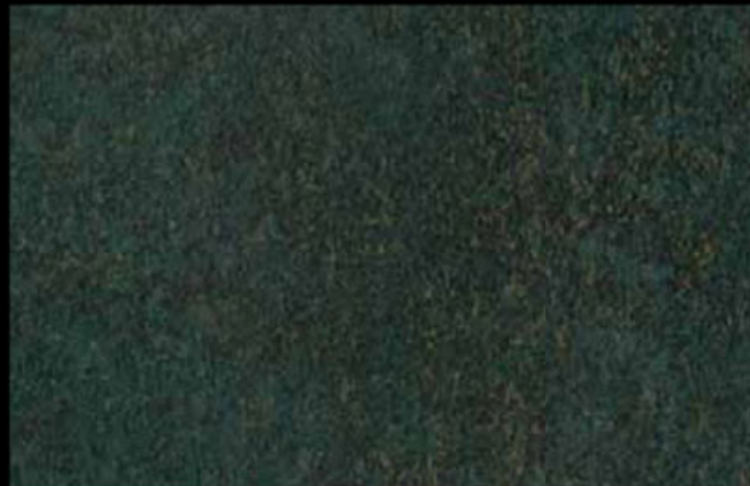
427 A KLONDIKE (LT. 1) + COLORI Col. 427 (6 ML.) KLONDIKE (LT. 2,5) + COLORI Col. 427 (15 ML.)