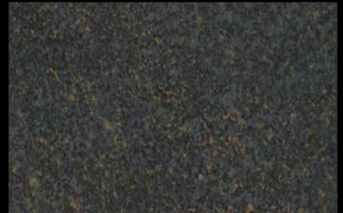
442 A KLONDIKE (LT. 1) + COLORI Col. 442 (6 ML.) KLONDIKE (LT. 2,5) + COLORI Col. 442 (15 ML.)