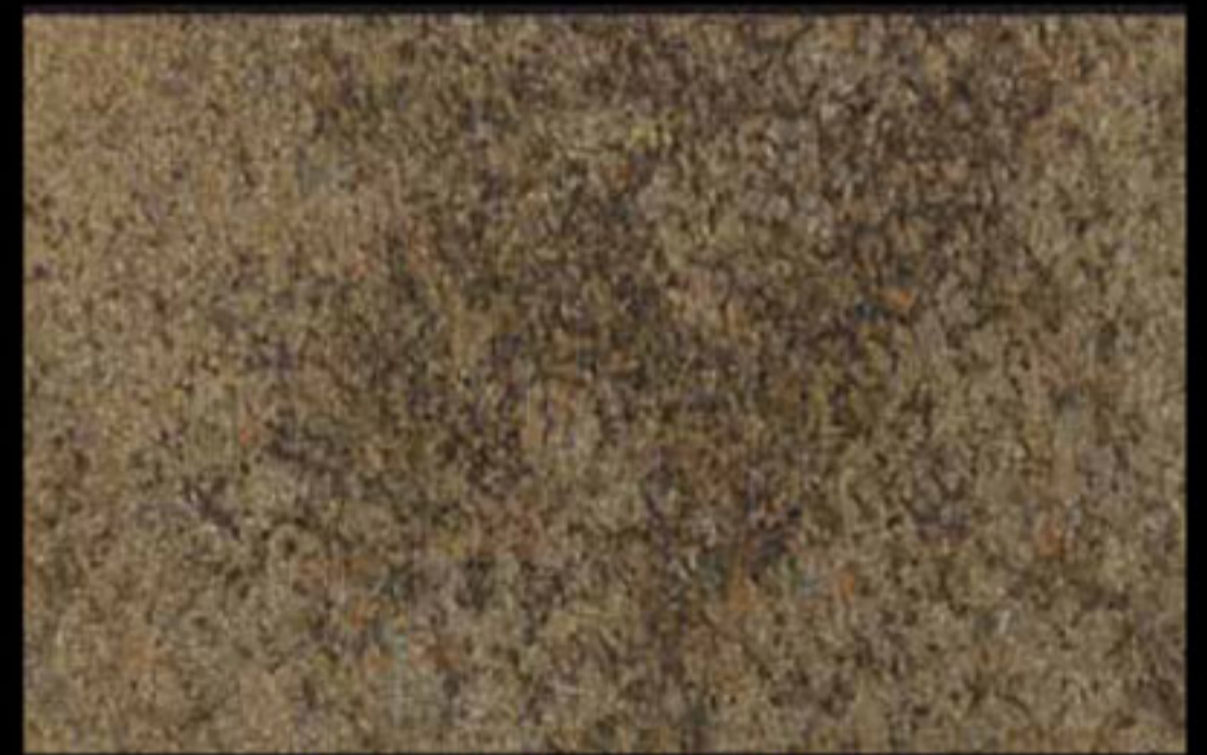
431 A + ADDITIVO SILVER G 200 KLONDIKE (LT. 1) + COLORÍ Col. 431 (6 ML.) + G 200 (LT. 0,100) KLONDIKE (LT. 2,5) + COLORÍ Col. 431 (15 ML.) + G 200 (LT. 0,250)