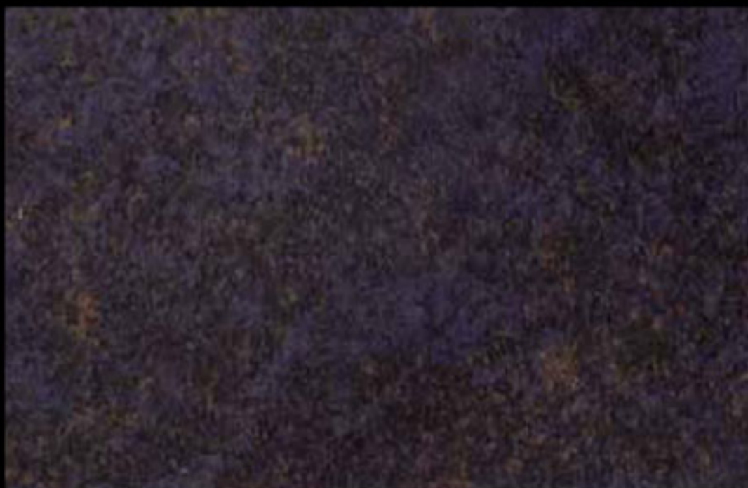
429 A KLONDIKE (LT. 1) + COLORÍ Col. 429 (6 ML.) KLONDIKE (LT. 2,5) + COLORÍ Col. 429 (15 ML.)