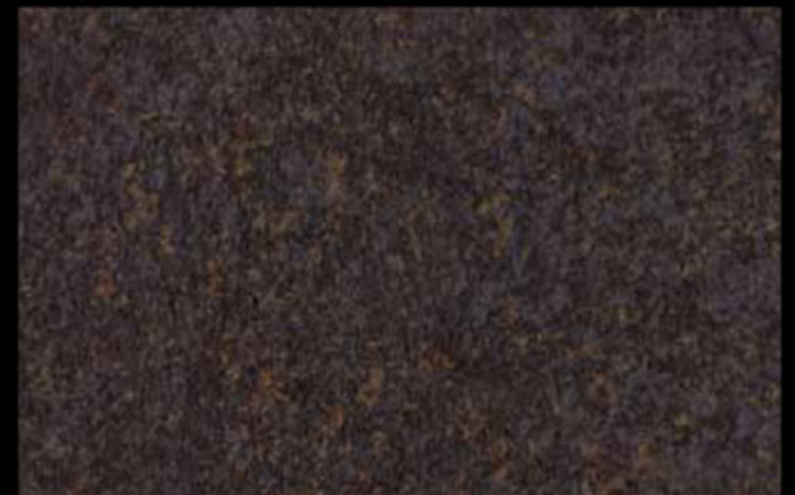
445 A KLONDIKE (LT. 1) + COLORÍ Col. 445 (6 ML.) KLONDIKE (LT. 2,5) + COLORÍ Col. 445 (15 ML.)