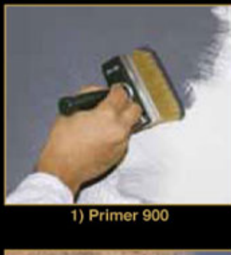
1) Primer 900