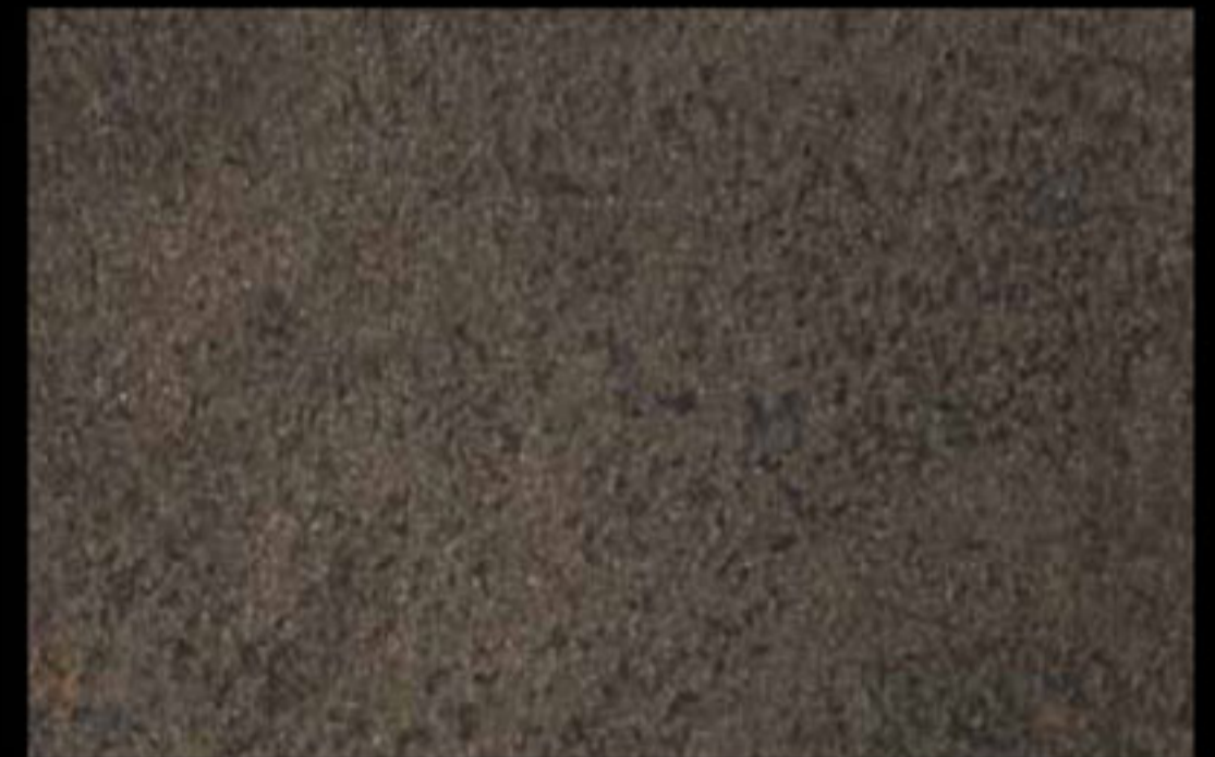
448 A + ADDITIVO GOLD G 100 KLONDIKE (LT. 1) + COLORÍ Col. 448 (6 ML.) + G 100 (LT. 0,100) KLONDIKE (LT. 2,5) + COLORÍ Col. 448 (15 ML.) + G 100 (LT. 0,250)