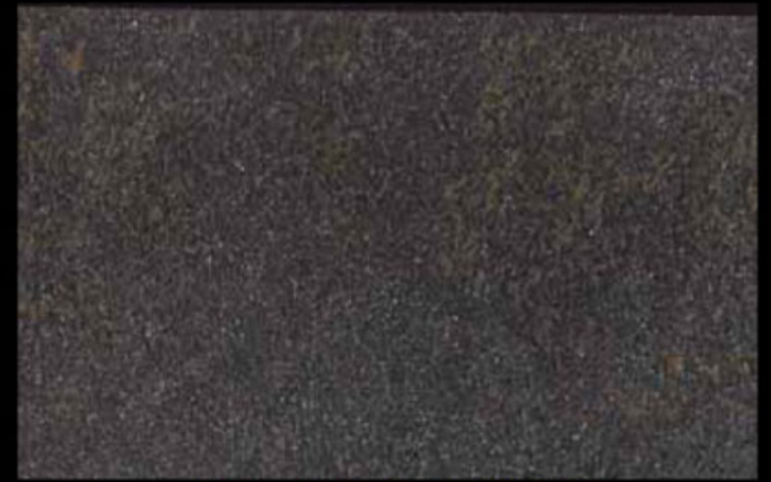
448 A + ADDITIVO SILVER G 200 KLONDIKE (LT. 1) + COLORÍ Col. 448 (6 ML.) + G 200 (LT. 0,100) KLONDIKE (LT. 2,5) + COLORÍ Col. 448 (15 ML.) + G 200 (LT. 0,250)