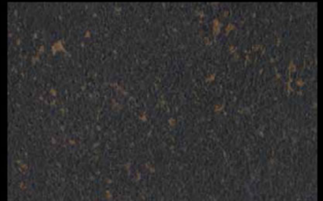
448 A KLONDIKE (LT. 1) + COLORÍ Col. 448 (6 ML.) KLONDIKE (LT. 2,5) + COLORÍ Col. 448 (15 ML.)