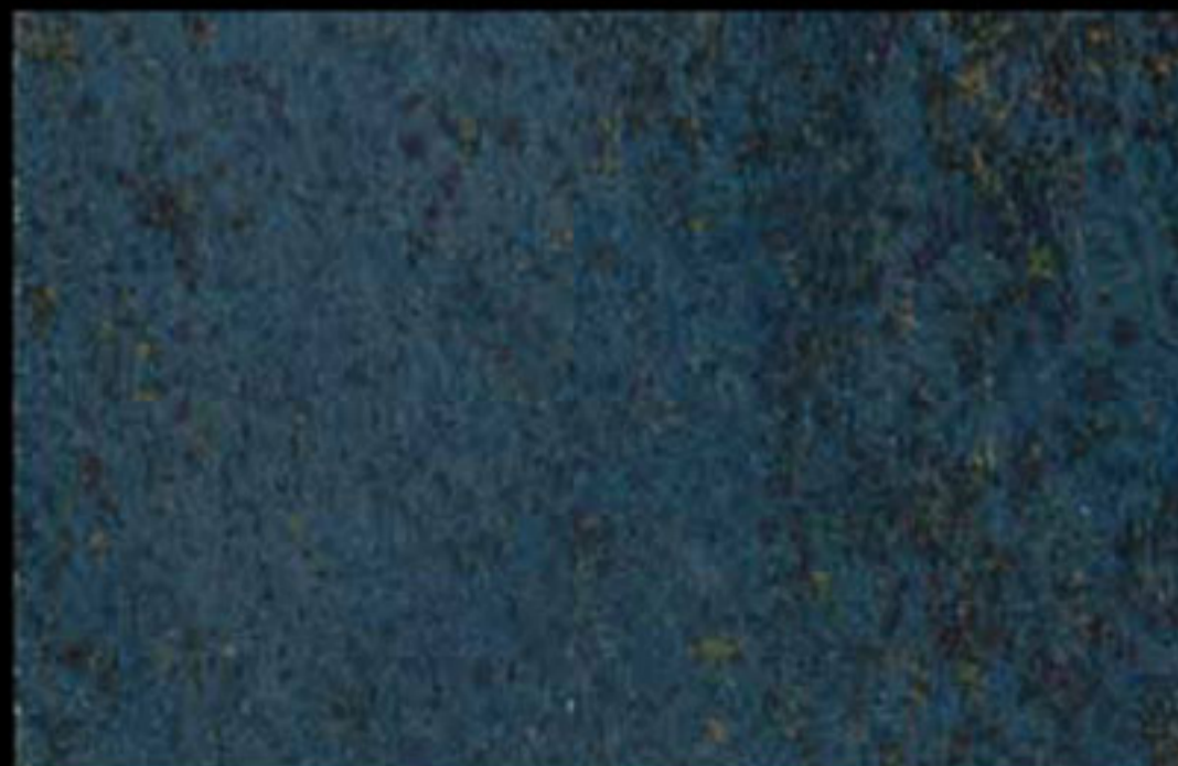
447 A KLONDIKE (LT. 1) + COLORÍ Col. 447 (6 ML.) KLONDIKE (LT. 2,5) + COLORÍ Col. 447 (15 ML.)