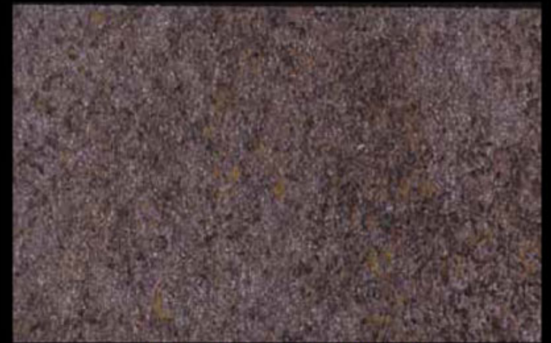
445 A + ADDITIVO SILVER G 200 KLONDIKE (LT. 1) + COLORÍ Col. 445 (6 ML.) + G 200 (LT. 0,100) KLONDIKE (LT. 2,5) + COLORÍ Col. 445 (15 ML.) + G 200 (LT. 0,250)