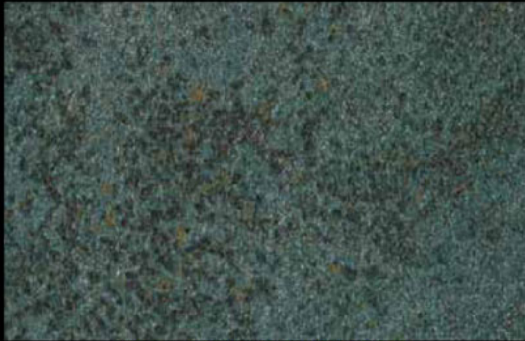
453 A + ADDITIVO SILVER G 200 KLONDIKE (LT. 1) + COLORI Col. 453 (6 ML.) + G 200 (LT. 0,100) KLONDIKE (LT. 2,5) + COLORI Col. 453 (15 ML.) + G 200 (LT. 0,250)