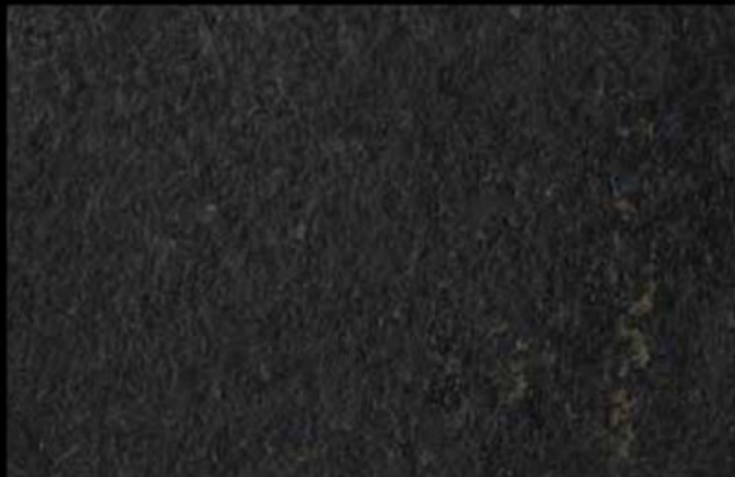
451 A KLONDIKE (LT. 1) + COLORÍ Col. 451 (6 ML.) KLONDIKE (LT. 2,5) + COLORÍ Col. 451 (15 ML.)