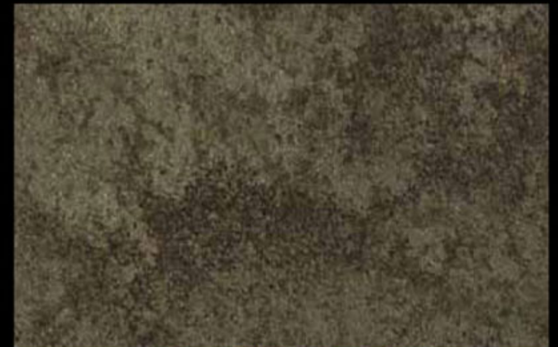
442 A + ADDITIVO GOLD G 100 KLONDIKE (LT. 1) + COLORI Col. 442 (6 ML.) + G 100 (LT. 0,100) KLONDIKE (LT. 2,5) + COLORI Col. 442 (15 ML.) + G 100 (LT. 0,250)