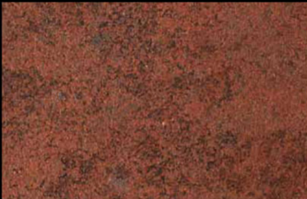
454 A + ADDITIVO GOLD G 100 KLONDIKE (LT. 1) + COLORÍ Col. 454 (6 ML.) + G 100 (LT. 0,100) KLONDIKE (LT. 2,5) + COLORÍ Col. 454 (15 ML.) + G 100 (LT. 0,250)