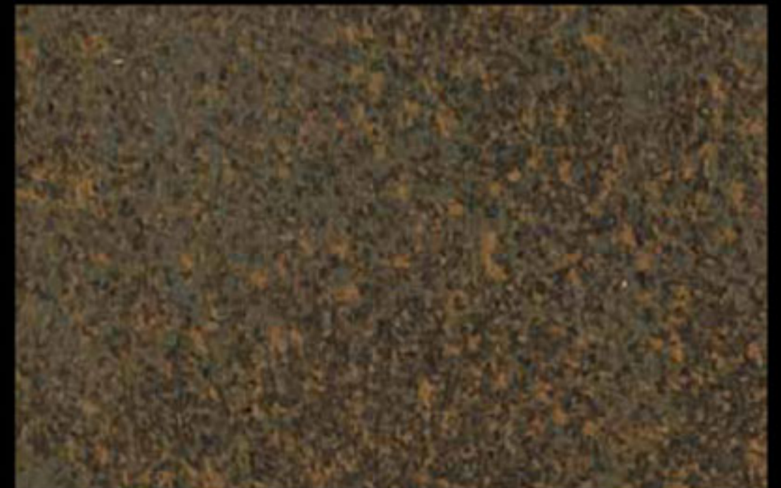
431 A KLONDIKE (LT. 1) + COLORÍ Col. 431 (6 ML.) KLONDIKE (LT. 2,5) + COLORÍ Col. 431 (15 ML.)