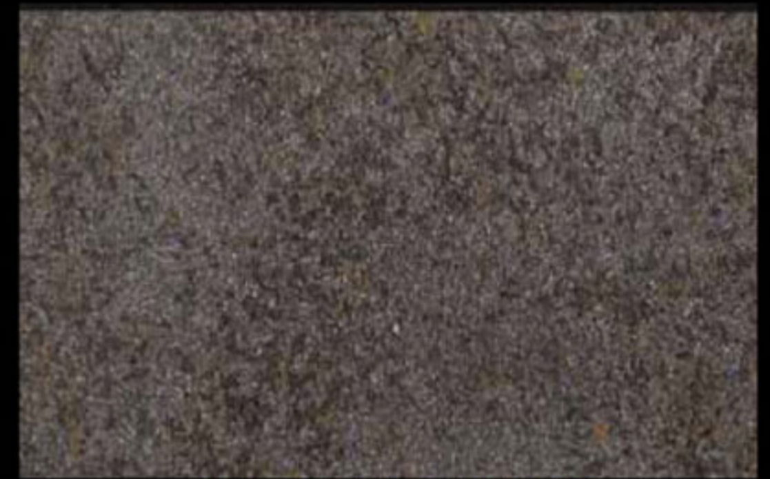
425 A + ADDITIVO SILVER G 200 KLONDIKE (LT. 1) + COLORÍ Col. 425 (6 ML.) + G 200 (LT. 0,100) KLONDIKE (LT. 2,5) + COLORÍ Col. 425 (15 ML.) + G 200 (LT. 0,250)