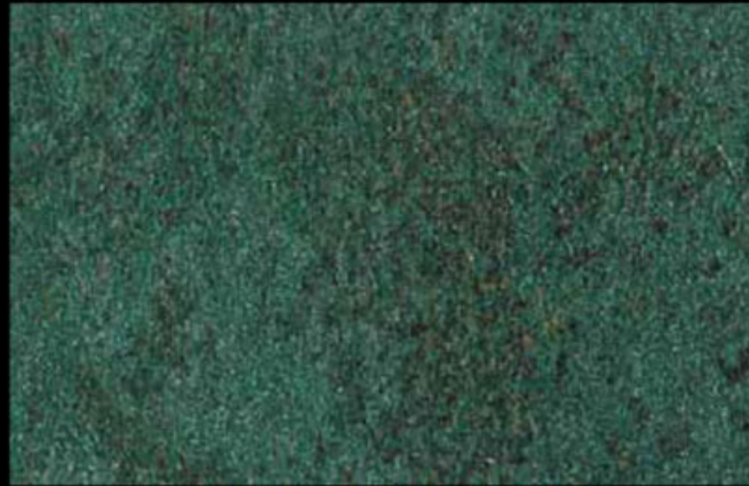
427 A + ADDITIVO SILVER G 200 KLONDIKE (LT. 1) + COLORI Col. 427 (6 ML.) + G 200 (LT. 0,100) KLONDIKE (LT. 2,5) + COLORI Col. 427 (15 ML.) + G 200 (LT. 0,250)