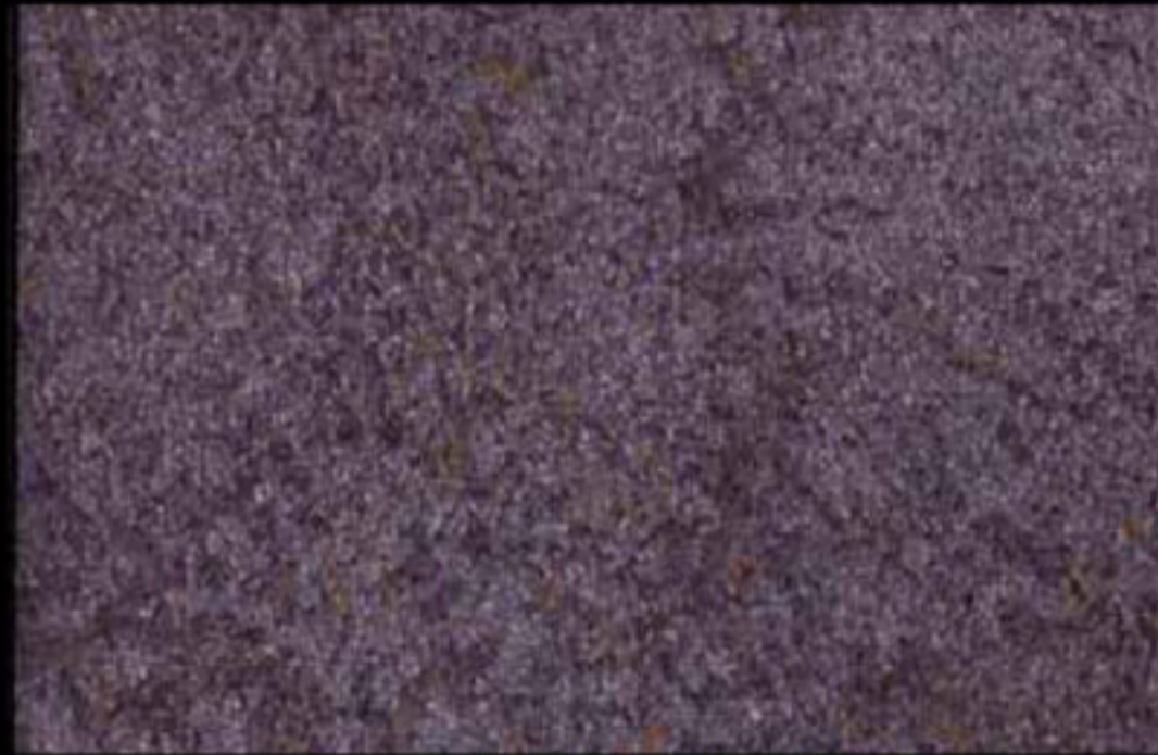
429 A + ADDITIVO SILVER G 200 KLONDIKE (LT. 1) + COLORÍ Col. 429 (6 ML.) + G 200 (LT. 0,100) KLONDIKE (LT. 2,5) + COLORÍ Col. 429 (15 ML.) + G 200 (LT. 0,250)