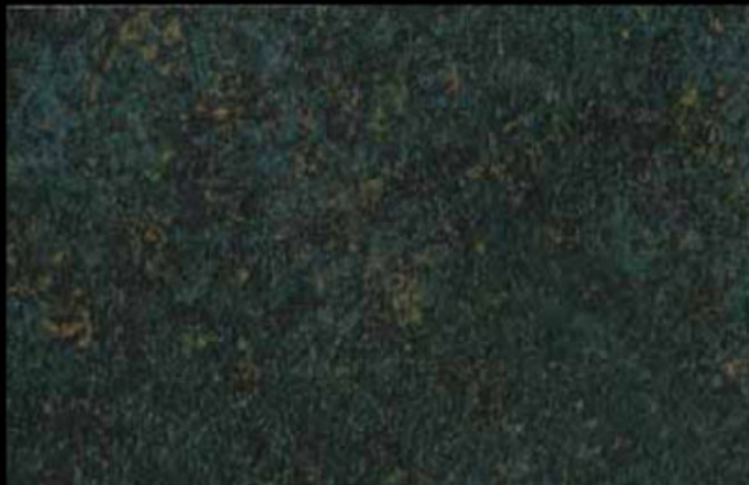
453 A KLONDIKE (LT. 1) + COLORI Col. 453 (6 ML.) KLONDIKE (LT. 2,5) + COLORI Col. 453 (15 ML.)