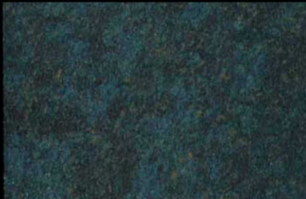
428 A + ADDITIVO GOLD G 100 KLONDIKE (LT. 1) + COLORÍ Col. 428 (6 ML.) + G 100 (LT. 0,100) KLONDIKE (LT. 2,5) + COLORÍ Col. 428 (15 ML.) + G 100 (LT. 0,250)