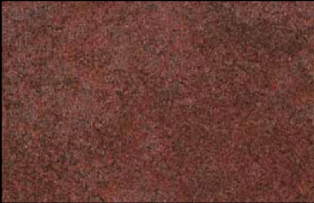
454 A + ADDITIVO SILVER G 200 KLONDIKE (LT. 1) + COLORÍ Col. 454 (6 ML.) + G 200 (LT. 0,100) KLONDIKE (LT. 2,5) + COLORÍ Col. 454 (15 ML.) + G 200 (LT. 0,250)