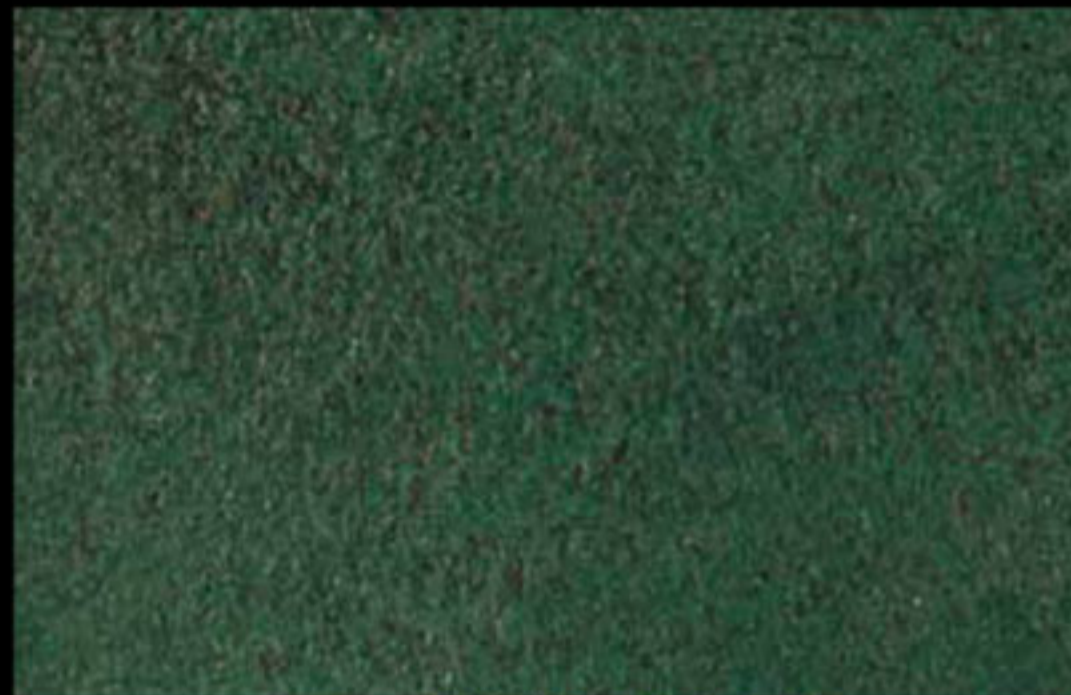
427 A + ADDITIVO GOLD G 100 KLONDIKE (LT. 1) + COLORI Col. 427 (6 ML.) + G 100 (LT. 0,100) KLONDIKE (LT. 2,5) + COLORI Col. 427 (15 ML.) + G 100 (LT. 0,250)