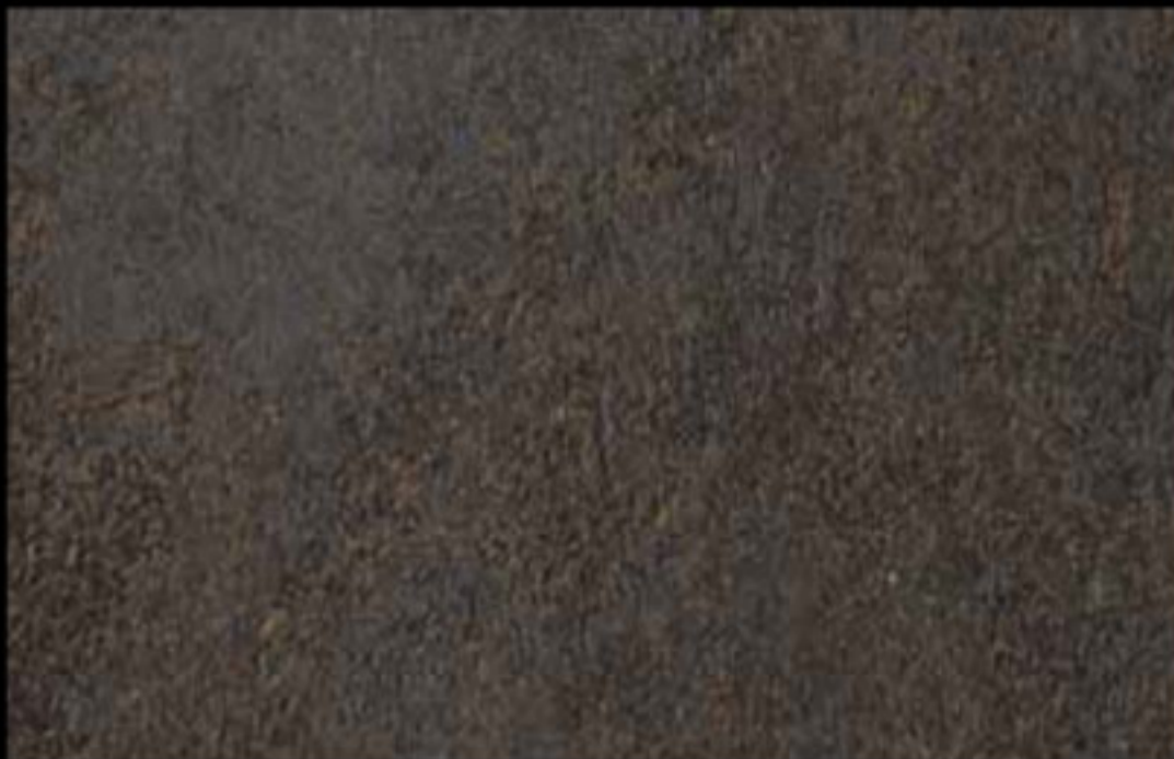
456 A KLONDIKE (LT. 1) + COLORÍ Col. 456 (6 ML.) KLONDIKE (LT. 2,5) + COLORÍ Col. 456 (15 ML.)