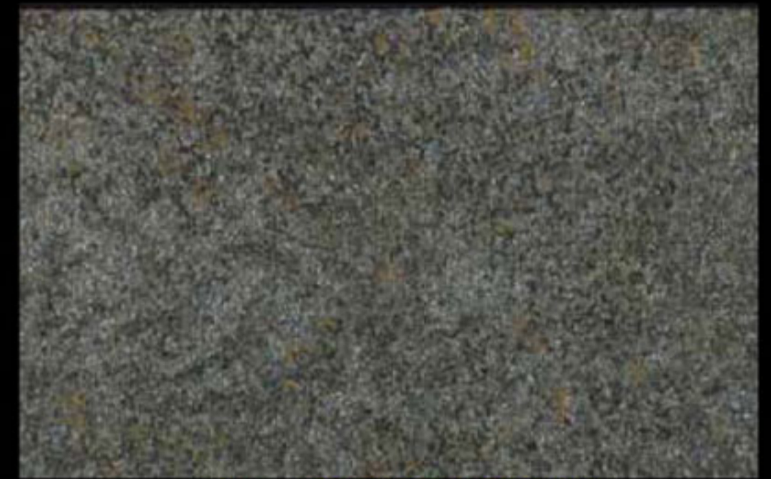
442 A + ADDITIVO SILVER G 200 KLONDIKE (LT. 1) + COLORI Col. 442 (6 ML.) + G 200 (LT. 0,100) KLONDIKE (LT. 2,5) + COLORI Col. 442 (15 ML.) + G 200 (LT. 0,250)