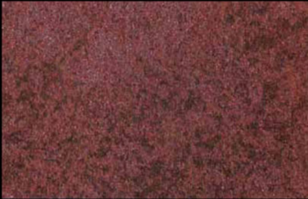
426 A + ADDITIVO SILVER G 200 KLONDIKE (LT. 1) + COLORÍ Col. 426 (6 ML.) + G 200 (LT. 0,100) KLONDIKE (LT. 2,5) + COLORÍ Col. 426 (15 ML.) + G 200 (LT. 0,250)