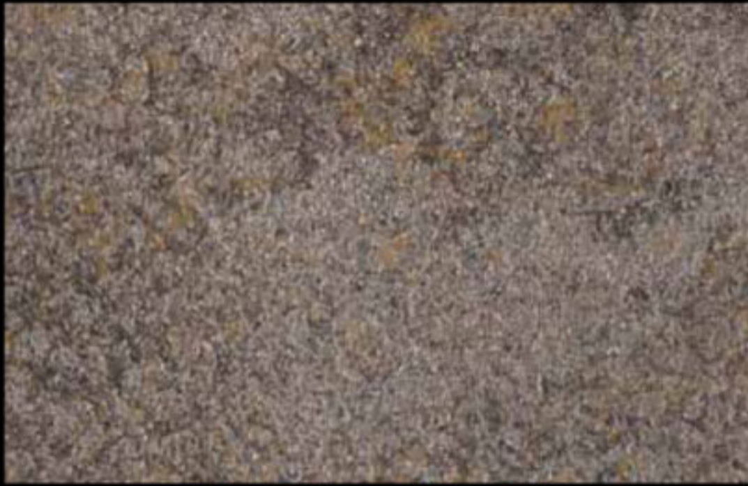
456 A + ADDITIVO SILVER G 200 KLONDIKE (LT. 1) + COLORÍ Col. 456 (6 ML.) + G 200 (LT. 0,100) KLONDIKE (LT. 2,5) + COLORÍ Col. 456 (15 ML.) + G 200 (LT. 0,250)