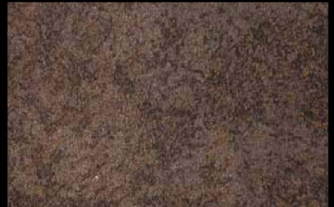
445 A + ADDITIVO GOLD G 100 KLONDIKE (LT. 1) + COLORÍ Col. 445 (6 ML.) + G 100 (LT. 0,100) KLONDIKE (LT. 2,5) + COLORÍ Col. 445 (15 ML.) + G 100 (LT. 0,250)