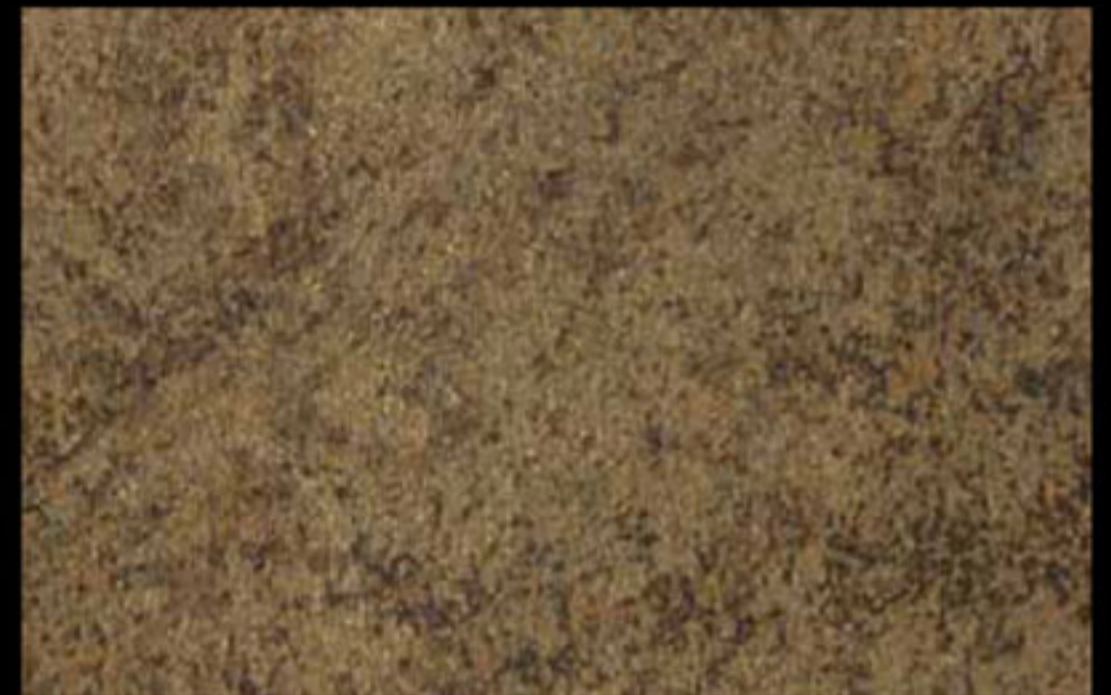
431 A + ADDITIVO GOLD G 100 KLONDIKE (LT. 1) + COLORÍ Col. 431 (6 ML.) + G 100 (LT. 0,100) KLONDIKE (LT. 2,5) + COLORÍ Col. 431 (15 ML.) + G 100 (LT. 0,250)